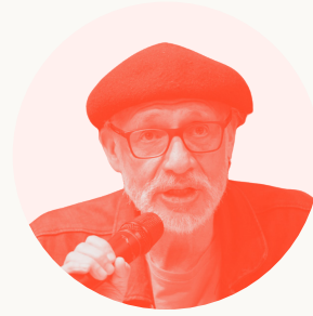
Santiago Castro-Gómez Filósofo e investigador descolonial

Enfocada en la decolonialidad, cuerpos y futuros desde saberes ancestrales. Propone una visión que desafía las estructuras coloniales, en busca de futuros más inclusivos y equitativos.