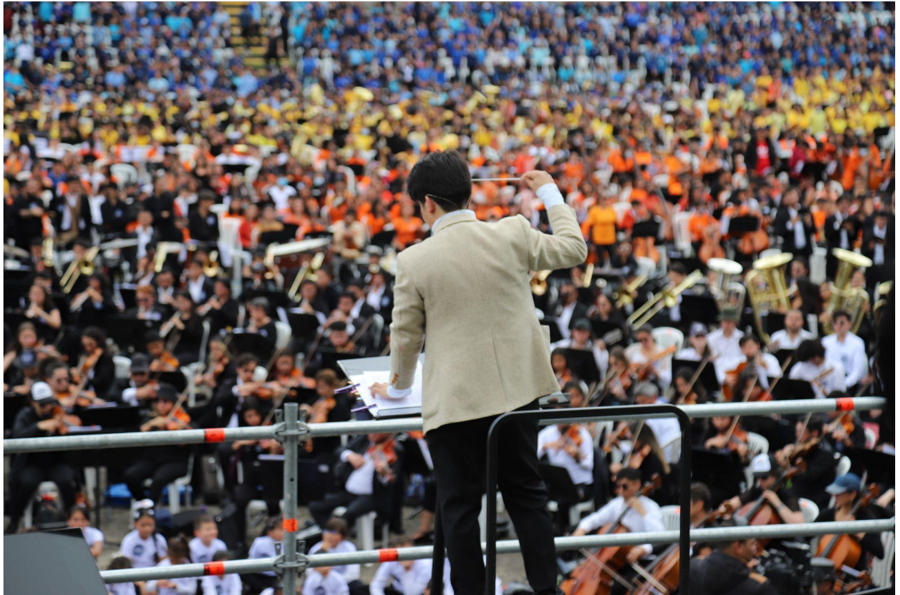
[Fotografía] de Gaitán Tarquino, John Jairo. (Bogotá, 2022). El concierto más grande del mundo de la Orquesta Filarmónica de Bogotá, 2022 . Fuente: SCRD. Colombia, Bogotá.