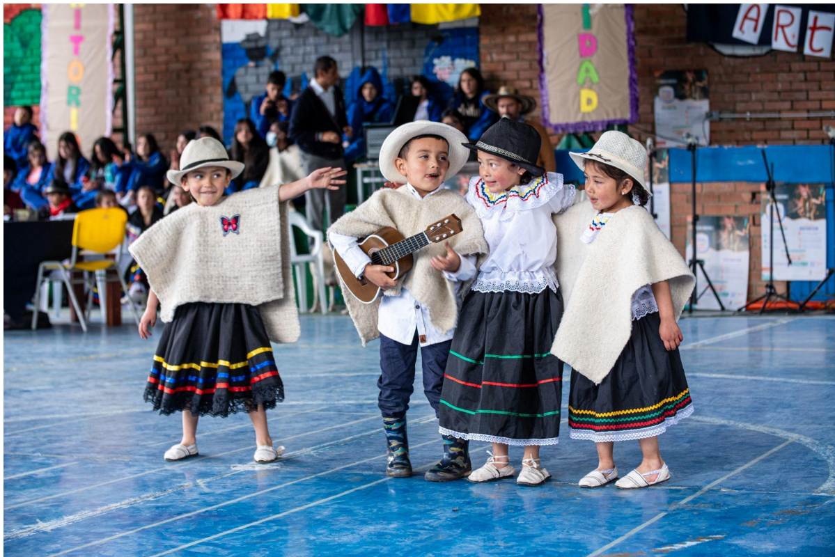
[Fotografía] de Calixto Cordero, Víctor Ulises. (Bogotá, 2023). Estudiantes de educación inicial en el Festival Escolar de las Artes - localidad de Sumapaz . Fuente: SCR. Colombia, Bogotá.

En aras de identificar las percepciones que se tienen sobre los procesos de formación impartidos por las entidades adscritas a la Secretaría Distrital de Cultura, Recreación y Deporte (SCRD) en Bogotá, en relación con los aportes que se realizan desde los mencionados cuatro fundamentos conceptuales y siete capacidades transversales, se implementa un instrumento de valoración denominado: Medición de las percepciones de la formación artística, cultural y deportiva , que busca dar cuenta sobre dichos procesos de formación, sobre las contribuciones que tienen en la vida, en el bienestar de los participantes y en el acceso, participación, contribución y disfrute cultural, recreativo y deportivo que reciben niñas, niños, adolescentes de la ciudad de Bogotá.