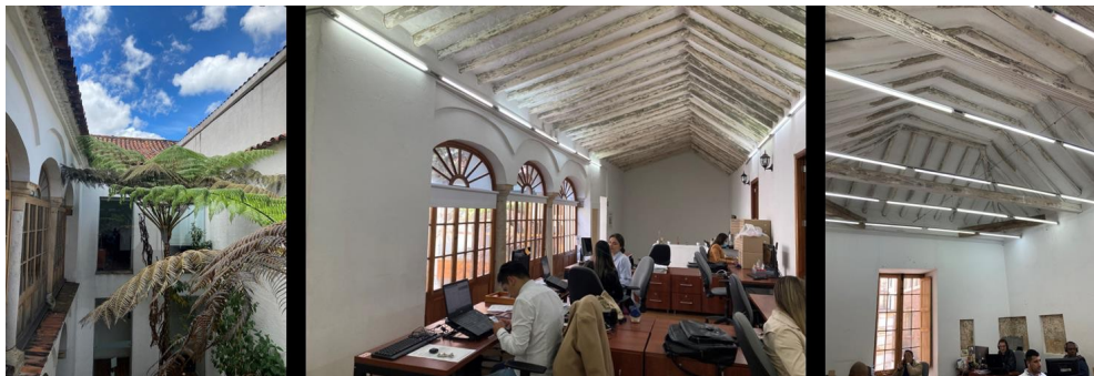
Registro fotográfico Casa Imprenta, Calle 9 6 17/19

Como resultado del informe técnico se recomienda: