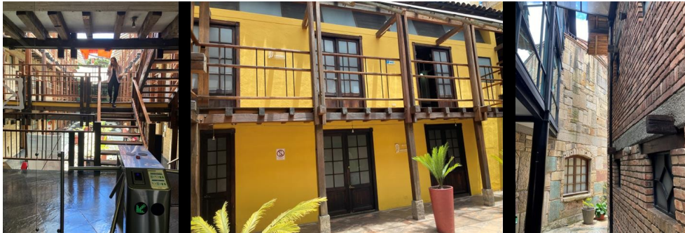
Registro fotográfico interior Casa Botica, Carrera 6 8 93/95/97