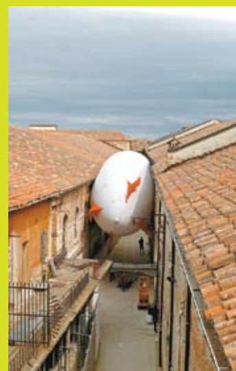
Enjambre de dirigibles , Bienal de Venecia, 2009.