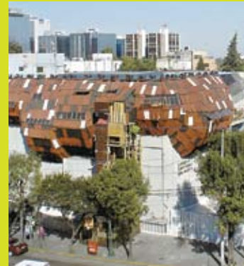
Paracaidista . Museo de Arte Carrillo Gil. 2004.

La carrera de Héctor Zamora se ha caracterizado por la serie de instalaciones que ha realizado en espacios públicos: