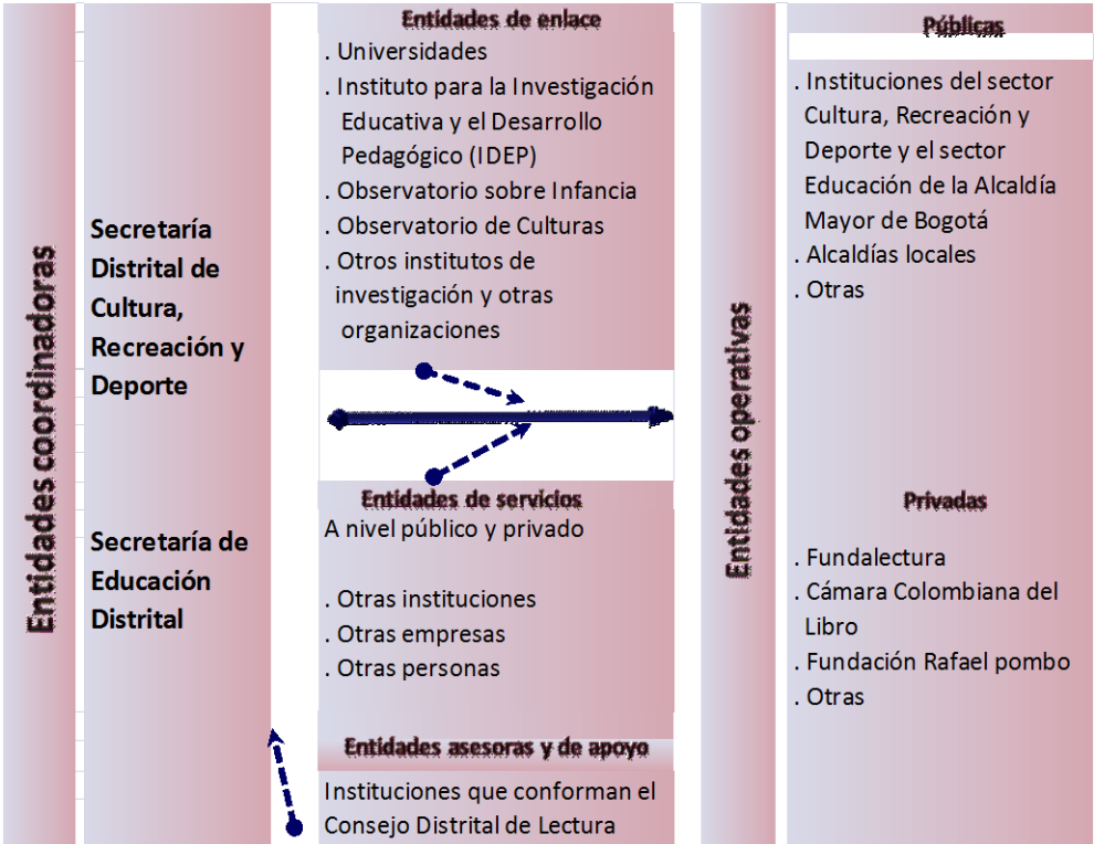
Gráfico 3 Estructura Organizativa del Plan DICE

Se buscará la participación de otras instituciones, empresas o personas al nivel público y privado para que apoyen el desarrollo del Plan a través del aporte de bienes o servicios.