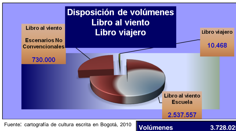
Gráfico 2 Materiales de lectura en Bogotá Colecciones Libro al viento (2004 a 2010) y Libro viajero