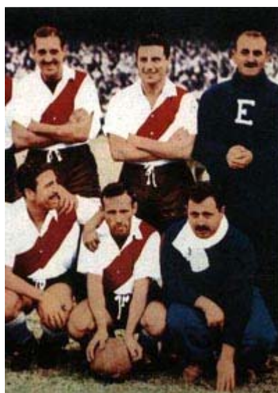
Los viejos PF del fútbol cumplían casi todas las funciones, algo hoy imposible.

Previo a comenzar con un somero análisis sobre el Preparador Físico - tema del cual este curso a distancia se ocupa - puede ser interesante conocer algunos aspectos sobre el Director Técnico - en distintos países también llamado director técnico, otras veces coach -, profesional casi siempre responsable de conducir el equipo, y a quien el preparador físico debe responder.