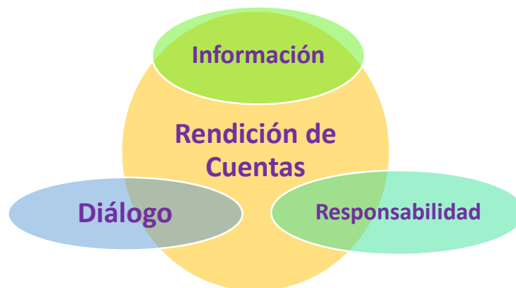
Ilustración 1. Elementos de la Rendición de Cuentas